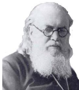
Άγιος Λουκάς ο ιατρός Αρχιεπίσκοπος Κριμαίας

Η σύνοδος αυτή αναθεμάτισε όλους αυτούς που τολμούν να λένε ότι η προσκύνηση των ιερών εικόνων είναι ειδωλολατρία και οι ορθόδοξοι χριστιανοί είναι ειδωλολάτρες. Και εδώ οι αιρετικοί μας λένε ακριβώς αυτό το πράγμα. Τολμούν να αποκαλούν τις εικόνες μας είδωλα και εμάς ειδωλολάτρες. Και μέχρι που φτάνει το θράσος τους; Θα σας πω ένα περιστατικό που έγινε πρόσφατα σε μία πόλη της Σιβηρίας. Την ώρα της λειτουργίας δύο προτεστάντες (βαπτιστές) μπήκαν μέσα στην εκκλησία και άρχισαν εκεί να φωνάζουν ότι οι ορθόδοξοι είναι ειδωλολάτρες και οι εικόνες τους είδωλα.