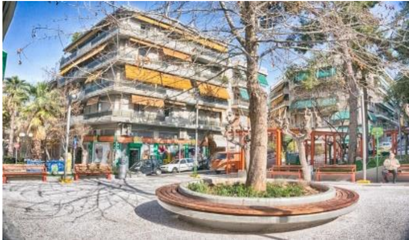
Πλατεία Παγκρατίου στὴν ΑΘΗΝΑ

Ἐννέα ἡ ὥρα τὸ βράδυ, βρίσκομαι στὴν πλατεία Παγκρατίου.