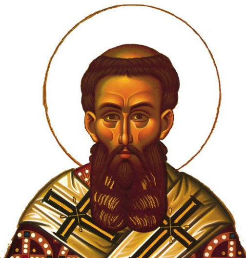
Άγιος Γρηγόριος ο Παλαμάς

Ο Άγιος Γρηγόριος ο Παλαμάς ήταν δεινός θεολόγος και διαπρεπέστατος ρήτορας και φιλόσοφος. Δεν γνωρίζουμε το χρόνο και τον τόπο της γέννησής του. (Ο Σ. Ευστρατιάδης όμως, στο αγιολόγιο του, αναφέρει ότι ο Άγιος Γρηγόριος γεννήθηκε το 1296 μ.Χ. στην Κωνσταντινούπολη, από τον Κωνσταντίνο τον Συγκλητικό και την ευσεβέστατη Καλλονή)