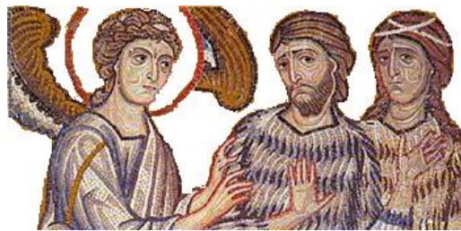
Η ΕΞΩΣΙΣ ΤΩΝ ΠΡΩΤΟΠΛΑΣΤΩΝ ΑΠΟ ΤΟΝ ΠΑΡΑΔΕΙΣΟ

Της από του παραδείσου της τρυφής εξορίας του Αδάμ.