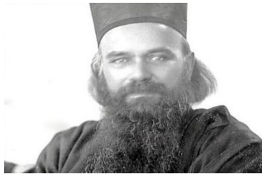
Ἁγιος Νικόλαος Βελιμίροβιτς

Τὸ πρόσωπο ὑποδηλώνει τὸν ἐξωτερικὸ, τὸν σωματικὸ καὶ αἰ-σθησιακὸ ἄνθρωπο - τὸ σῶμα τοῦ ἀνθρώπου. Μὲ τίς σωματι-κὲς αἰσθήσεις καὶ τὰ αἰσθητήρια ὄργανα δείχνουμε στὸν κόσ-μο τί σκεφτόμαστε, τί νιώθουμε καὶ τί θέλουμε. Ἡ γλῶσσα λέει ὅσα ὁ νοῦς σκέφτεται, τὰ μάτια δείχνουν τὰ αἰσθήματα τῆς καρδίας καὶ τὰ πόδια ὁδηγοῦν ἐκεῖ πού ἡ ψυχὴ θέλει.